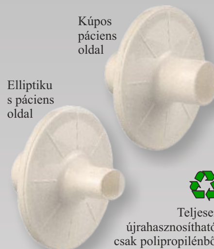
Kúpos páciens oldal